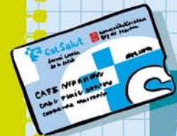
la targeta sanitària

Sabies que... Tothom té dret a tenir una targeta sanitària?