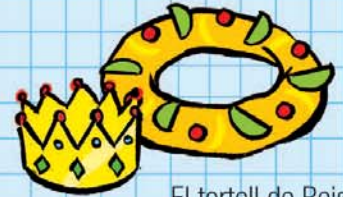
El tortell de Reis